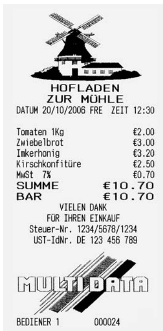
Bonnmuster mit grafischem Logo (Abbildung verkleinert)